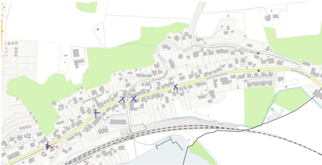
Illustration af Slangebakken, Kjærs Møllevej og indsnævringer på Himmelbjergvej.